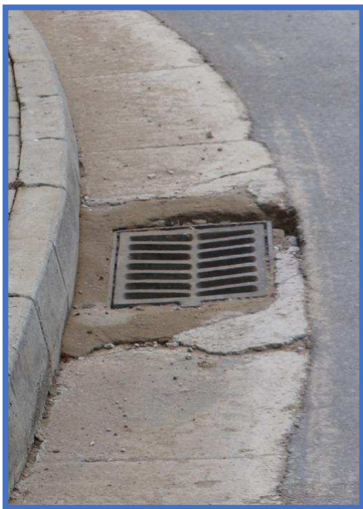
Fig 7 Cilesia e materialeve lidhese te kornizave te kanalizimeve anesore eshte tejet e ulet. Kjo ka cuar ne demtimin e tyre te plote vetem pak muaj pas instalimit