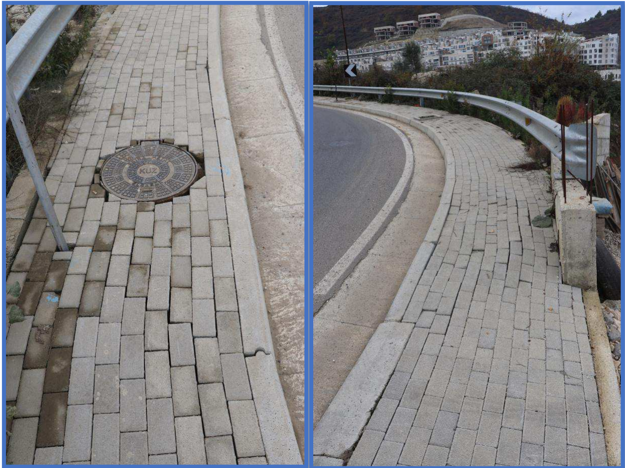
Fig 1 dhe 2

Trotualet jane jo te njetrajtshem me mungese te elementeve lidhes me pusetat dhe me levizje te shumta per sa i perket nivelit te tyre