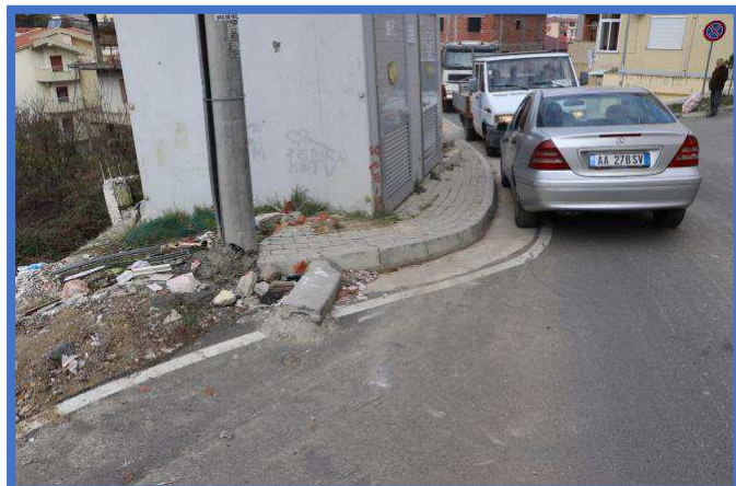
Fig 4 Trotuaret jane te demtuara per shkak te cilesise se ulet te punimeve