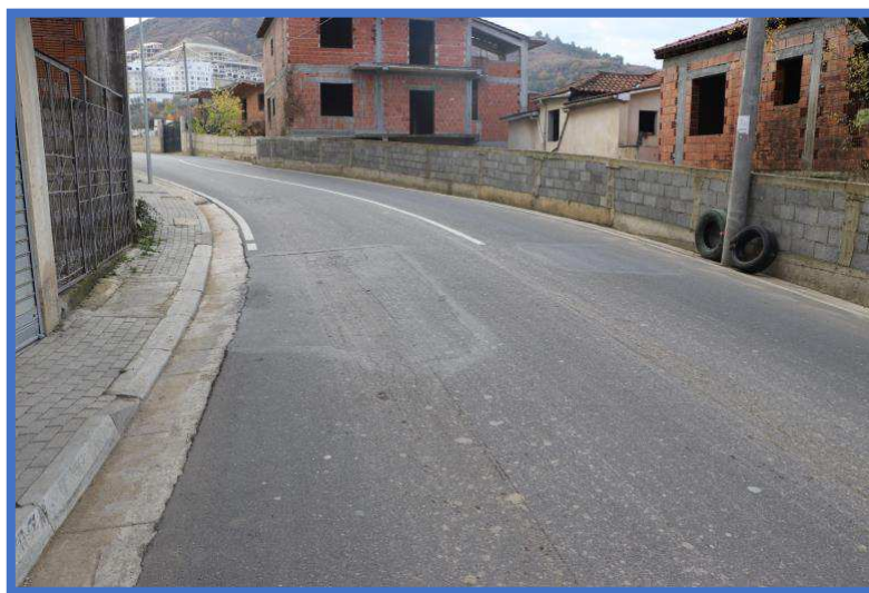
Fig 6 Vetem pak muaj pas ndertimit, rruga ka pesuar nderhyrje te shumta per shkak te mungeses se cilesise ne shtresat asfaltike apo planifikimin e kanalizimeve te ujrave te bardha/zeza dhe lidhjet elektrike