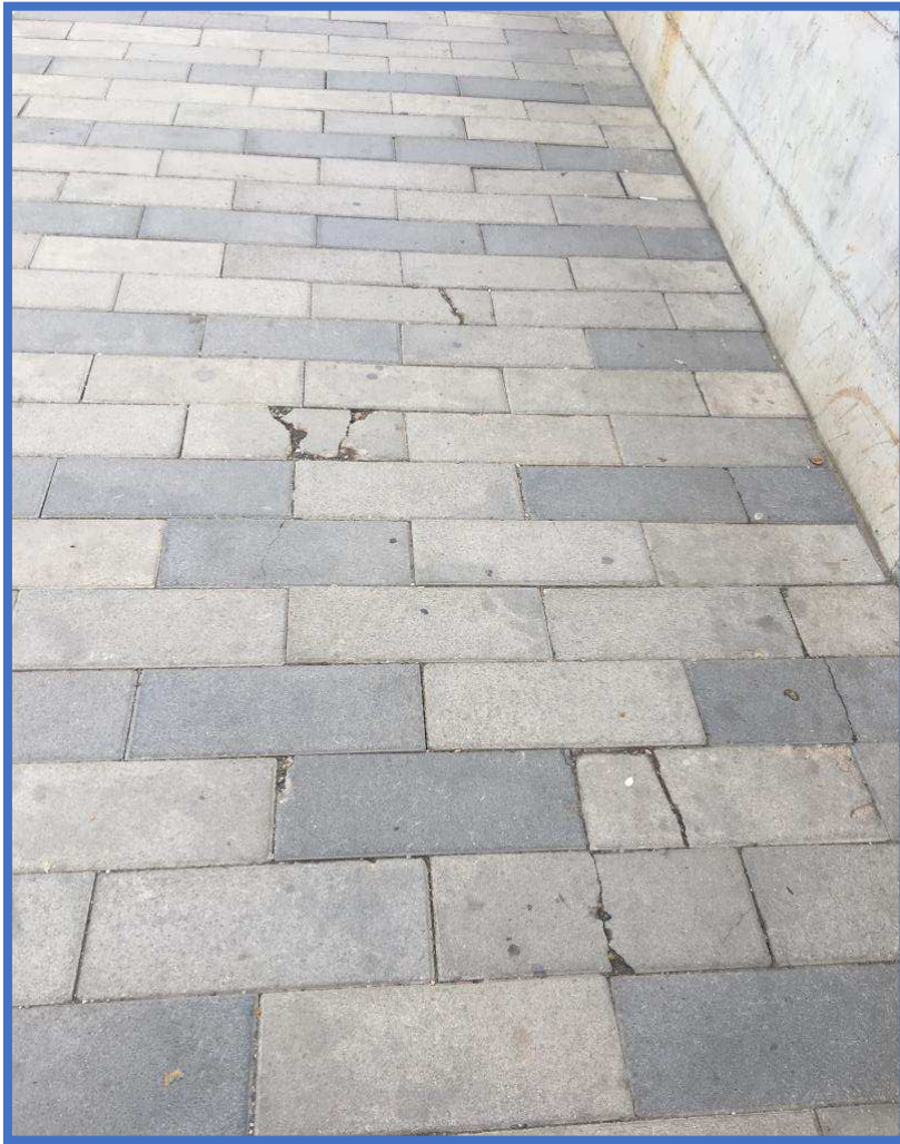
Fig 1 Vihen re thyerje e plasaritje te pllakave te trotuareve

Ka sipërfaqe të shtresës së asfaltit e cila ka filluar që të thërmohet e të shkëputet (gjë që tregon se shtresa asfaltike nuk është material cilësor dhe sipas standarteve);